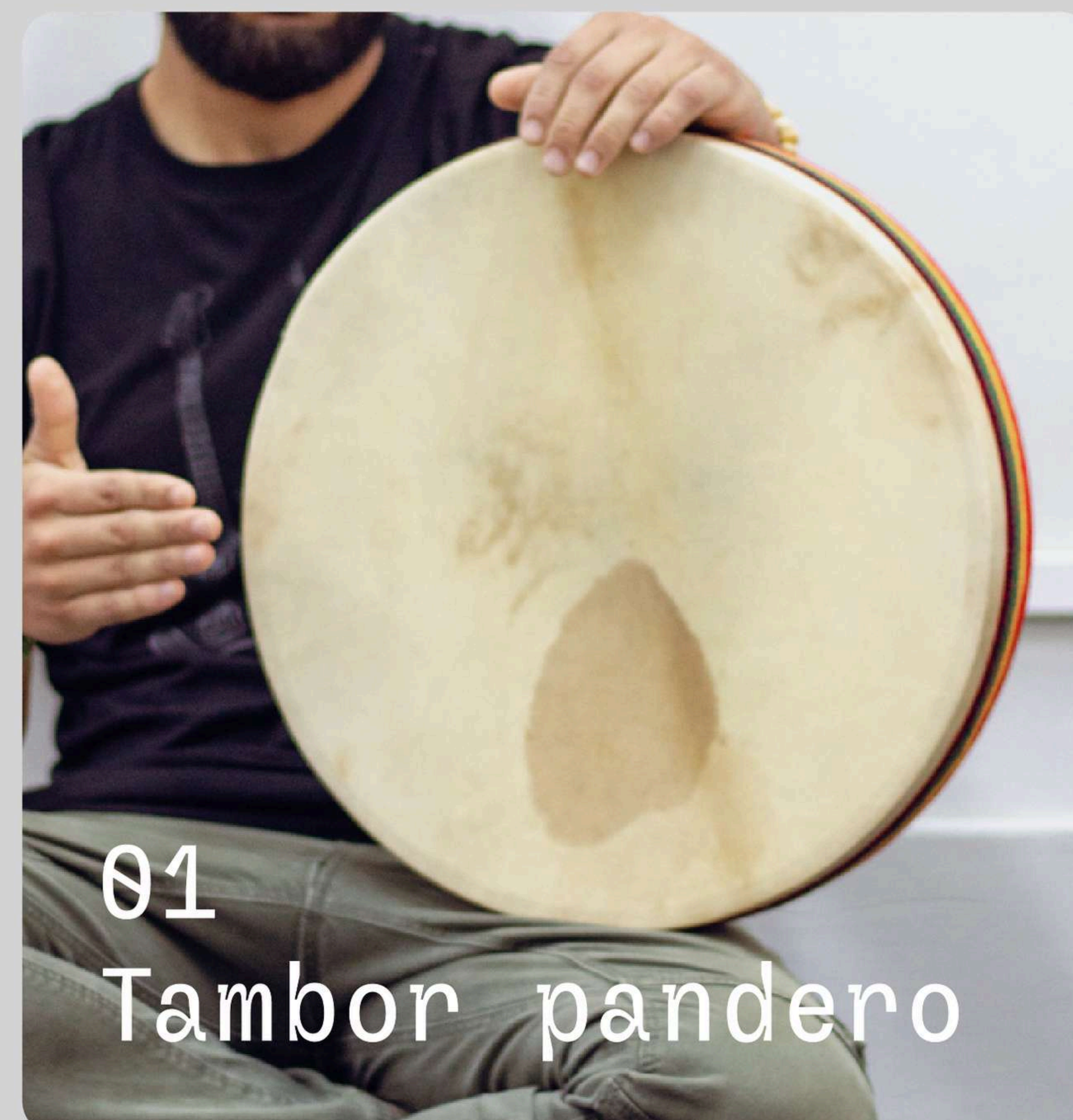
01 Tambor pandero