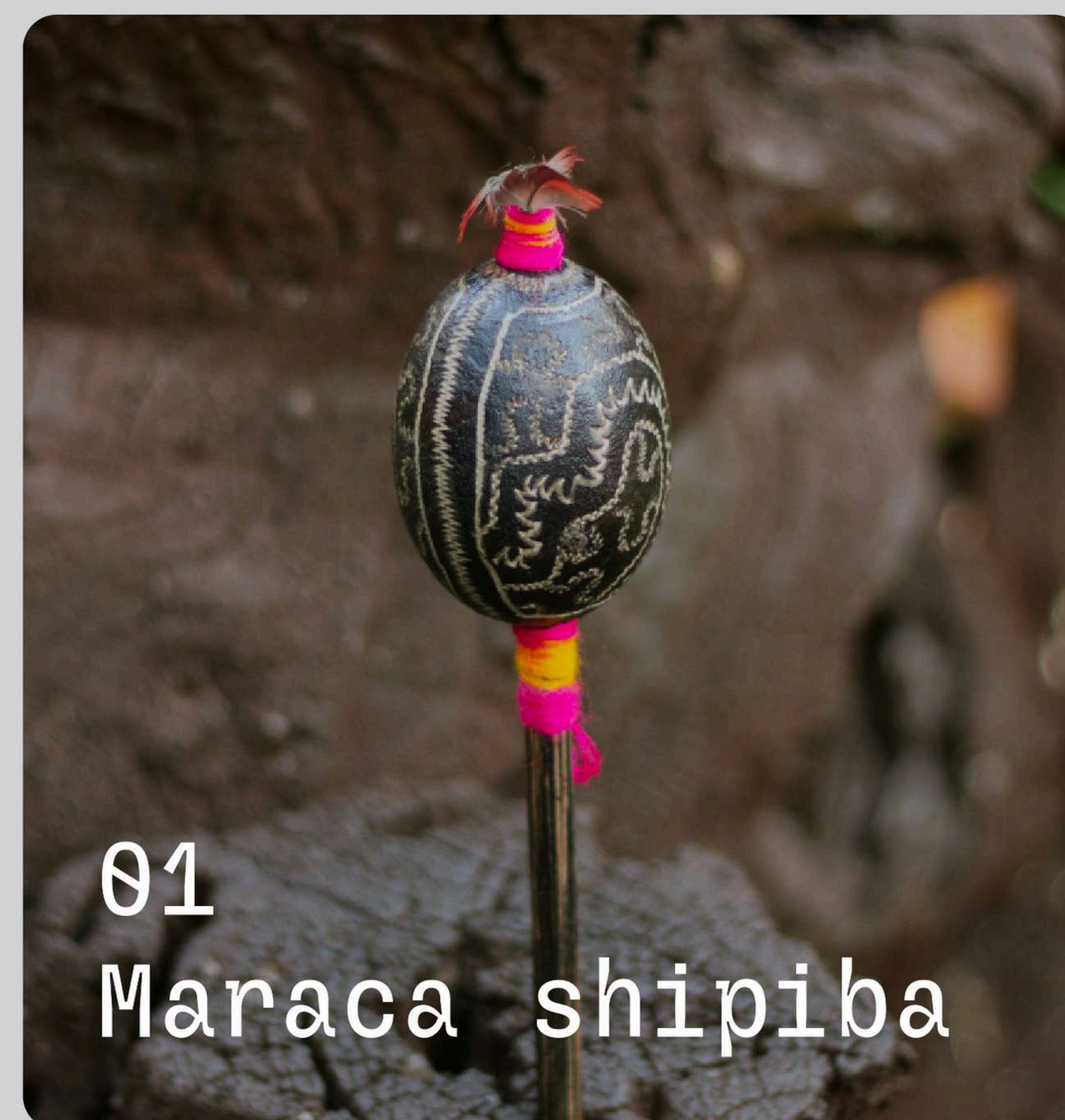
01 Maraca shipiba