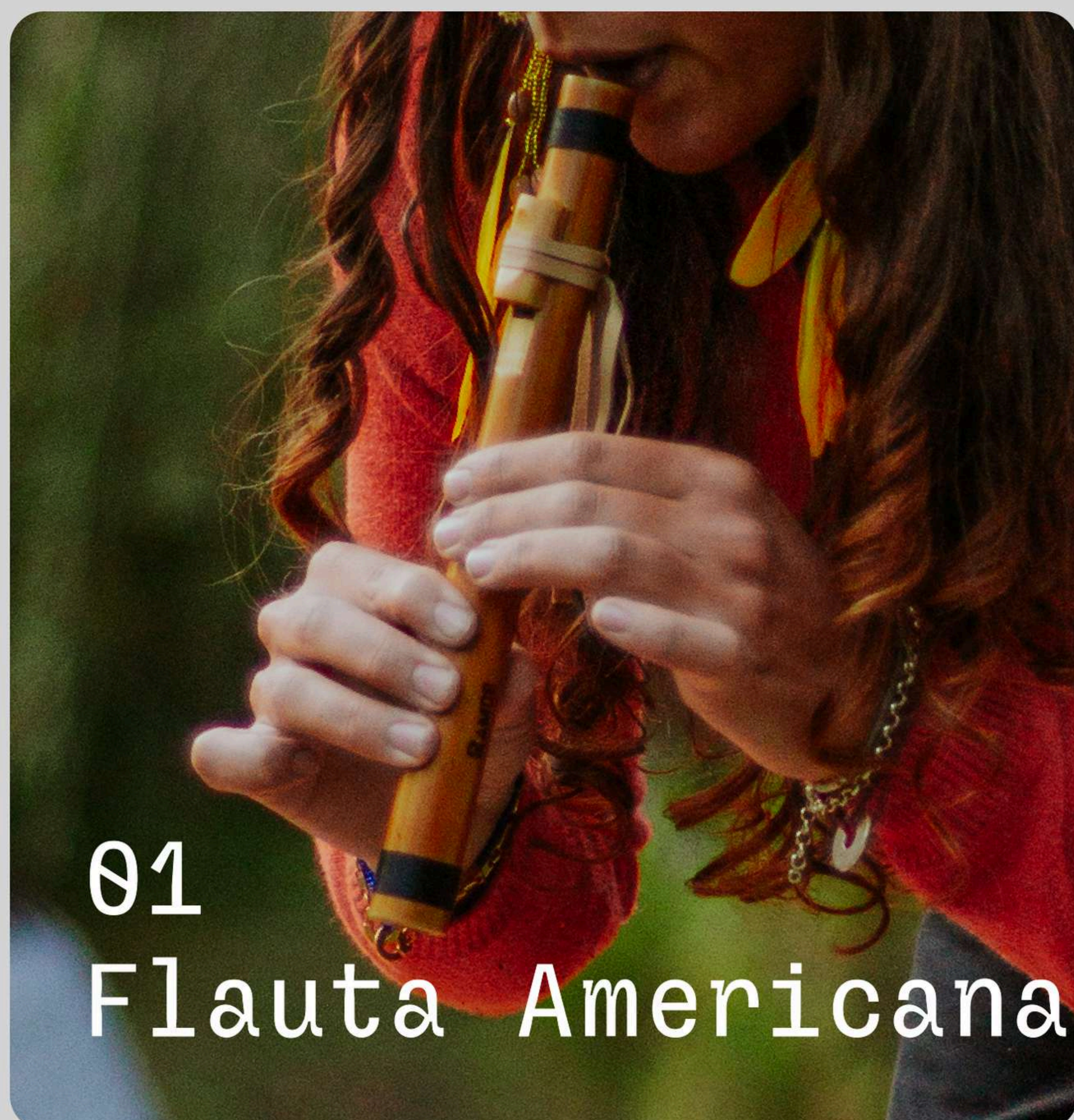
01 Flauta Americana