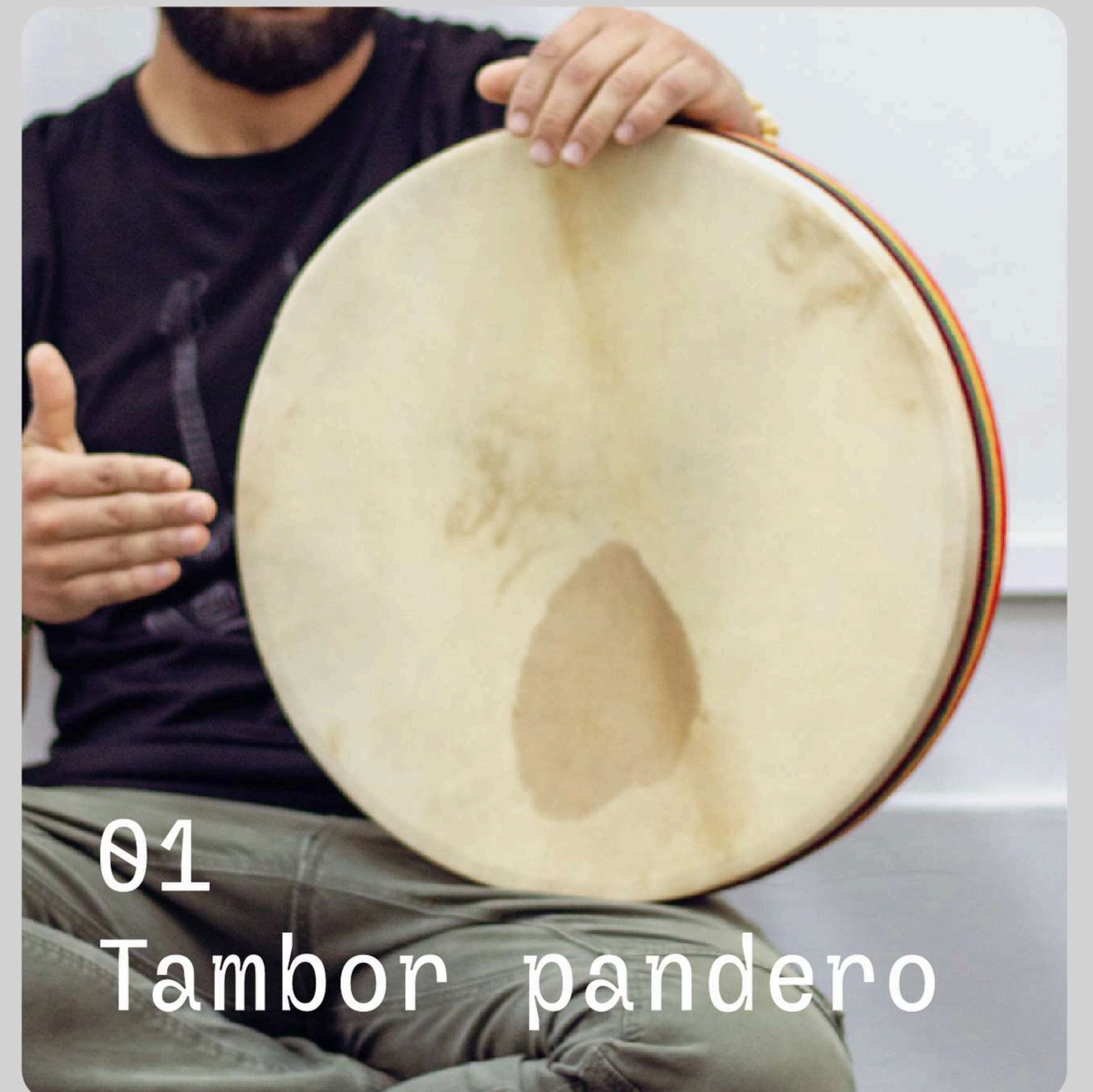
01 Tambor panderero