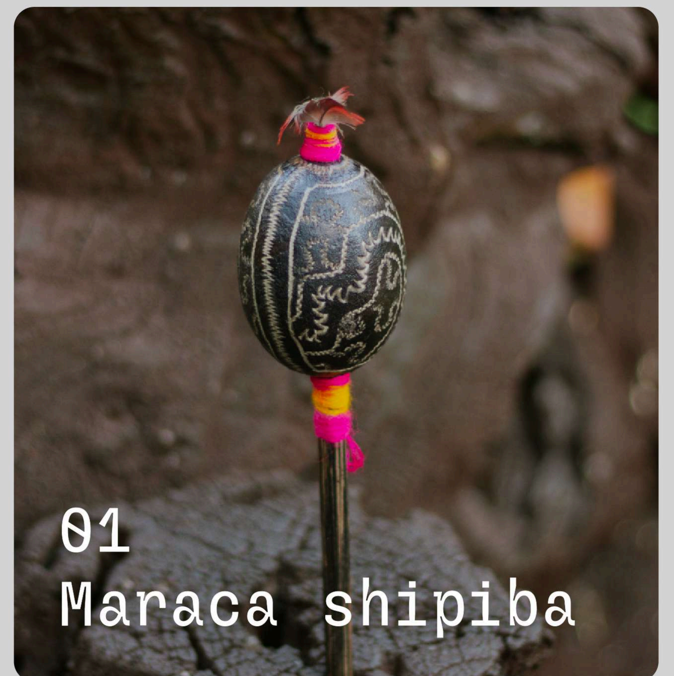
01 Maraca shipiba